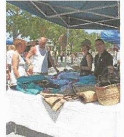
FIRA TEMÀTICA. Marítima i esportiva

Èxit de la V Festa del Mar, que ha donat la benvinguda a l'estiu