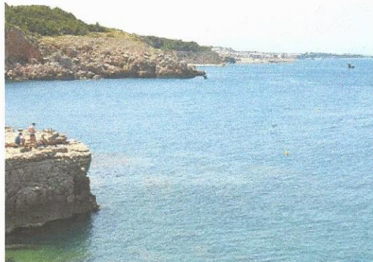
DOS TRAMS. De Riells al Port d'en Perris i de la zona del Port a Illa Mateua