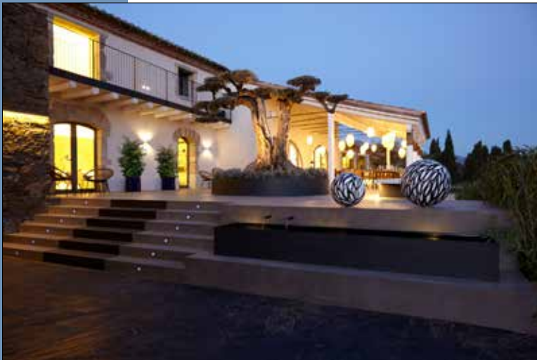
12 Llegado el atardecer, apreciamos las esferas, obras de Carles Bros, y el olivo en forma de nubes que marca la entrada el Mas.