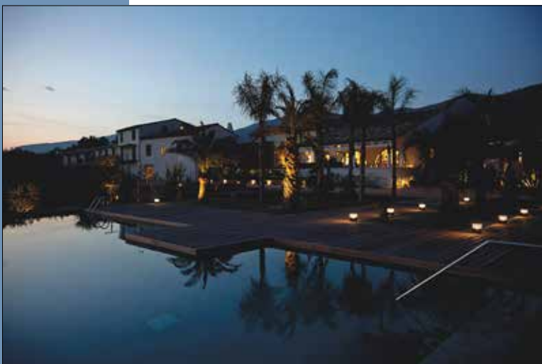
13 Vista del Mas desde la piscina, al atardecer.