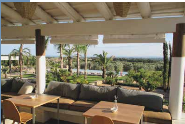
09 Terraza con vistas a los campos