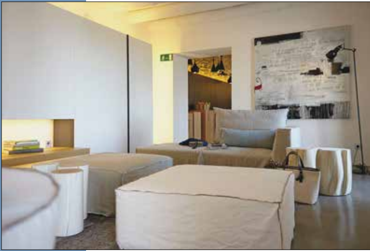
14 & 15 Sala de estar