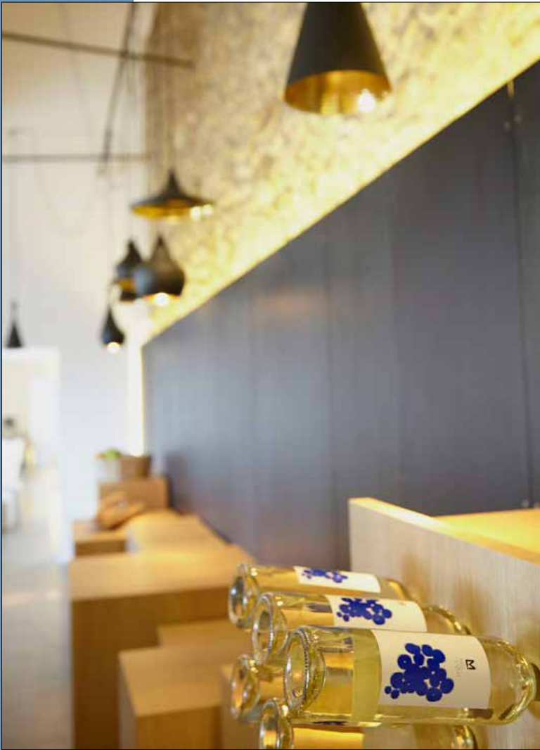
18 El vino del Mas