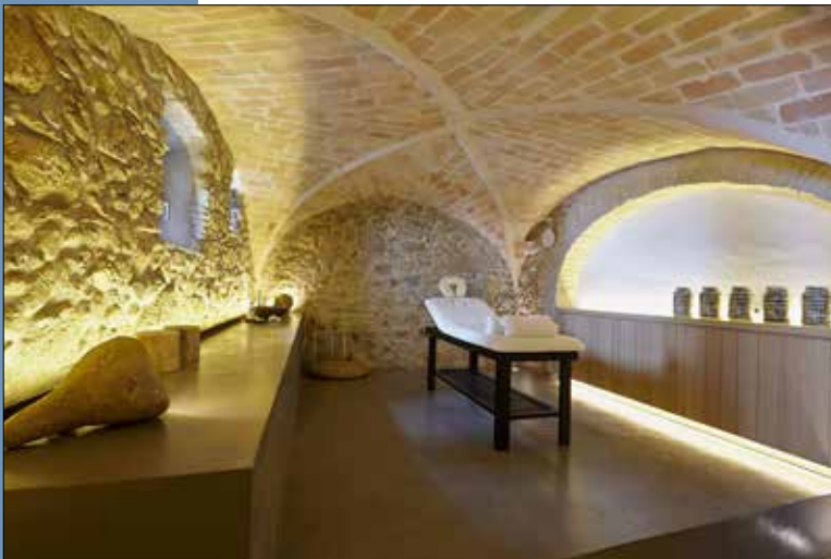
16 Sala de estética y bienestar