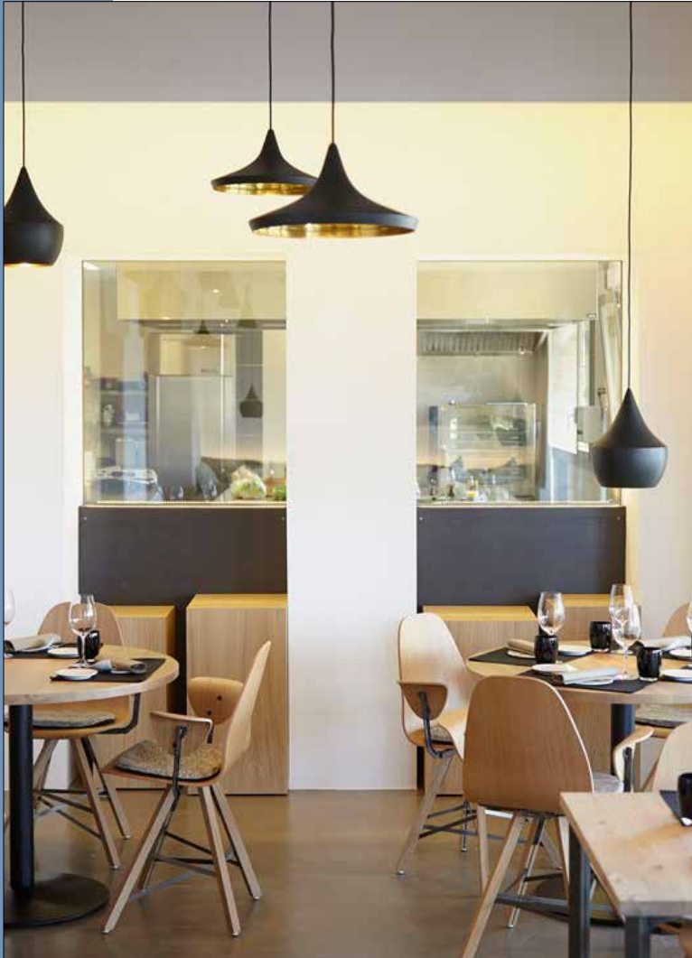
08 Vistas a la cocina