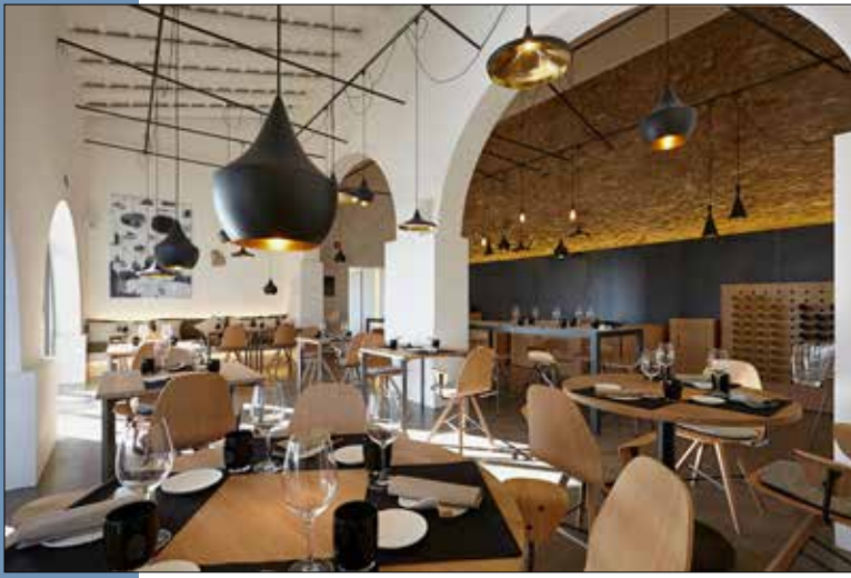
07 Sala interior del restaurante