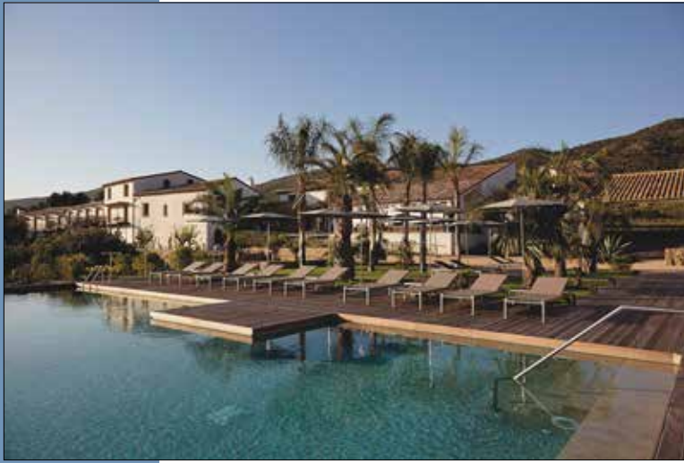
10 Vista desde la piscina