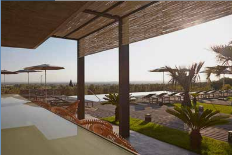
11 Vistas de la terraza, gozando del paisaje del Empordà